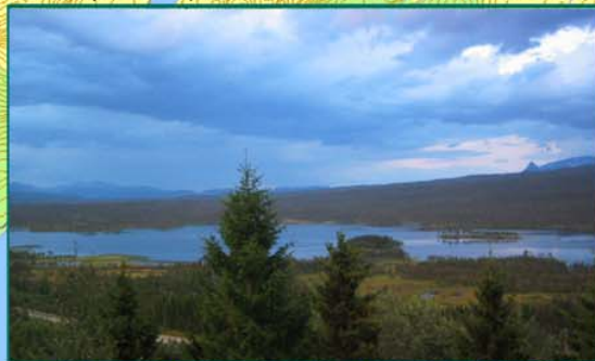
Østervikvannet (Snubbavannet) sett fra Snubba